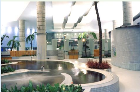
水着を着て入る温泉浴 "バーデゾーン"、天然温泉の露天風呂