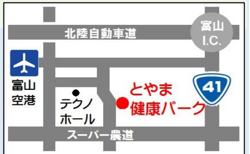
空港、テクノホール近く