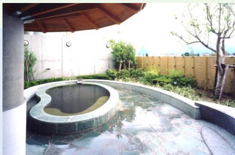
天然温泉の露天風呂