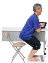
脚の運動機能チェック