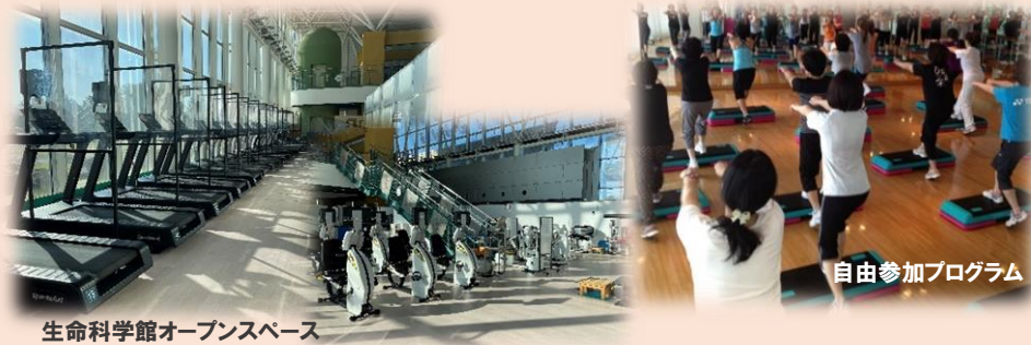
生命科学館オープンスペース