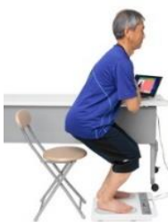
脚の運動機能チェック