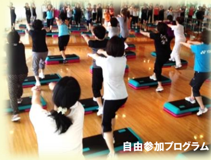
自由参加プログラム