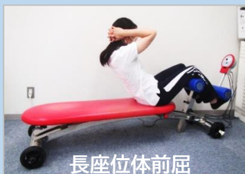
長座位体前屈 (筋持久力)