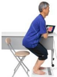
脚の運動機能チェック