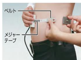
内臓脂肪面積チェック