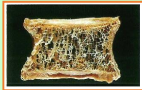
もろくなった背骨の断面