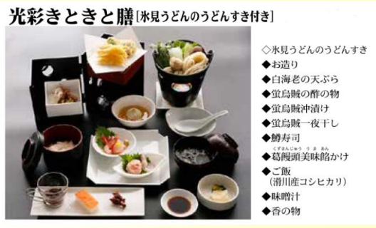
光彩きときと膳 [氷見うどんのうどんすき付き]

参加費 ・ウォーキング無料 ・昼食は、各自負担で現地払いです (「光彩きときと膳」 お一人2,160円)